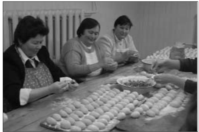
Totoriškus koldūnus svečiams pavaišinti gamino net kelios bendruomenės šeiminkės.