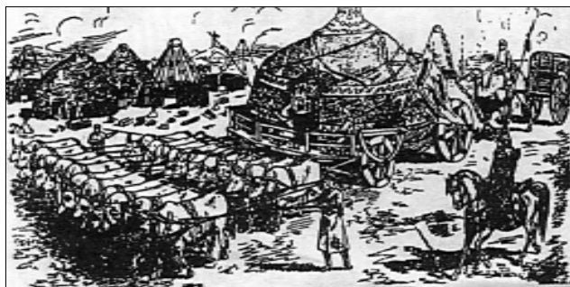
Čingis-chano pulkų stovykla. Viduramžių graviūra.

Ūkinė veikla ir prekyba Aukso Ordoje irgi buvo atitinkamai sutvarkyta. Reikiamu grūdų kiekiu apsirūpindavo patys gyventojai. Žemdirbiai vadinosi "sabanči" ("saban" – arklas), o tie, kas juos aprūpindavo žeme ir inventoriūmi – "urtakči" ("urtak" – pusiau). Ši visuomenės dalis aprūpindavo žmones