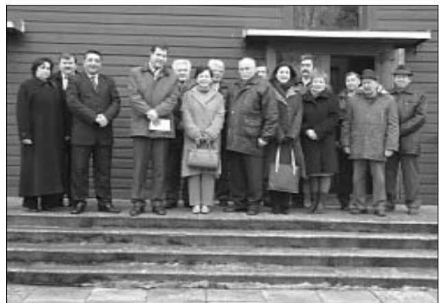
Bendra nuotrauka prie Raižių mečetės.

jog totorių bendruomenė stiprės. Du jų sūnūs studijuoja Turkijoje, laisvai kalba turkiškai, abu skaito Koraną. Ambasadorė patarė verslininkų šeimai paraginti sūnus greičiau vesti ir padovanoti bendruomenei atžalų. Šiltai pabendraavę, ambasados pasiuntiniai išvyko pasimelsti prie totorių kapų Raižių kapinėse.