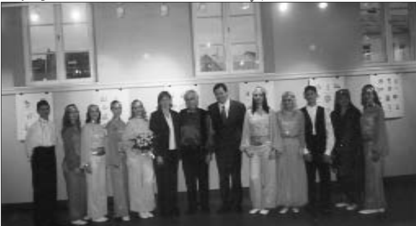
Mūsų ansamblis "Alije" Kėdainių daugiakultūrinio centro scenoje.