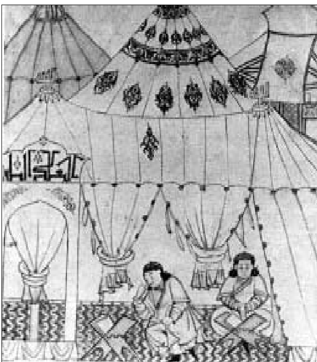
Čingis-chano “jasos” skaitymas. Viduramžių miniatiūra.