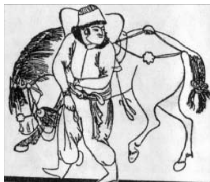
Mongolas su arkliu, viduramžių persų piešinys.