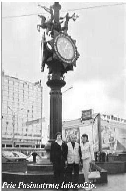
Prie Pasimatymų laikrodžio.