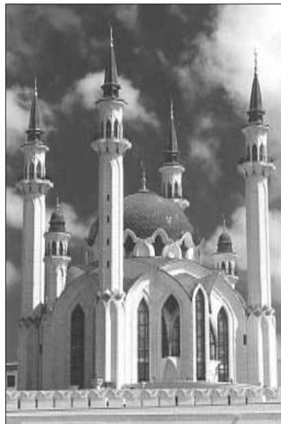
Мечеть Кул Шариф

Затем на автобусе мы поехали на просмотр картин и скульптурных изваяний Б.Урманче, известного по скульптуре Мусе Джалилю – легендарному татарскому поэту, автору