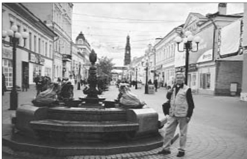
Kazanėje Baumano gatvėje.

vių – Volgos bulgarų, 9 – 10 amžiuje sukūrusių pirmąją Europoje musulmonišką valstybę, kurioje klestėjo prekyba, amatai, žemės ūkis, mokslas ir kultūra, istoriją. Taip pat aplankėme Archeologijos muziejų, kuriame pamatėme neįkainojamus Volgos bulgarų aukštos kultūros įrodymus. Mus nustebino tai, kad 1732 – 34 metais tarp musulmonų šventyklų buvo pastatyta cerkvė.