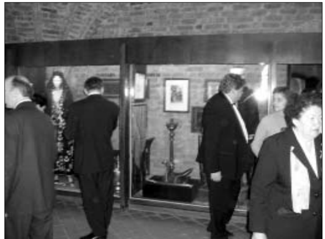
Renginio dalyviai apžiūri totorių ekspoziciją.

Alytaus, Kauno, Klaipėdos, Visagino totorių bendruomenių, įvairių šalių diplomatai, akredituoti Lietuvoje, Tautinių mažumų ir išeivijos departamento ir Tautinių bendrijų namų darbuotojai, Trakų ir Varėnos savivaldybių atstovai.