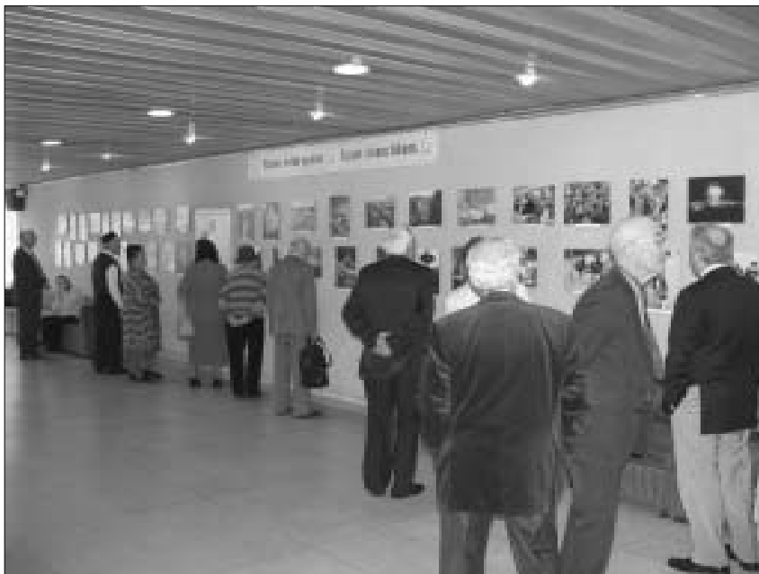
Участники праздника осматривают фотовыставку с видами Казани.

Выставка объединяет все города Литвы, где есть татарские общины. В нашем городе экспозиция фотографий будет действовать до конца июня, и все же-