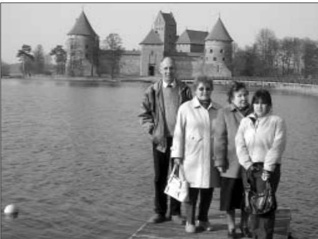
Kauniečiai Trakų pilies fone.

Atidarant ekspoziciją dalyvavo per šimtą svečių iš Vilniaus,