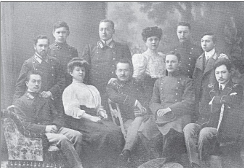
Lenkijos - Lietuvos totorių būrelis 1907-1908 metais Sank-Peterburge.

Pirmiausiai tai sekmadieninė mokykla. Nustatykite kriterijus. Sekmadieninė mokykla turi aprėpti tris dalykus - religijos, tautos istorijos ir meno saviveiklos pagrindus. Tai pirmas reikalavimas. Antas reikalavimas tame, jog mokyti mūsų vaikus tegali mokytojai iš mūsų tarpo, o ne arabai ar turkai. Aš nieko neturiu nei prieš vienus, nei prieš kitus, kaip mums draugiškus piliečius. Bet tik mes patys giliai suvokiame mūsų skaudulius ir mūsų problemas, tik mes patys galime rasti jų sprendimus, ir niekas iš šalies negali mums padėti. Visi kiti gali tik padūsauti, ar pasiūlyti jų mentalitetui būdingus sprendimus, kurie mažai ką bendro turi su mumis. Su arabais ir turkais mes galime ir turime draugauti, bet, gerbiamieji, nelaukite, kad jie spręstų mūsų problemas. Tai mažų mažiausiai nerimta. Juk mes savo tarpe turime du aukštai išlavintus religijos autoritetus. Vienas