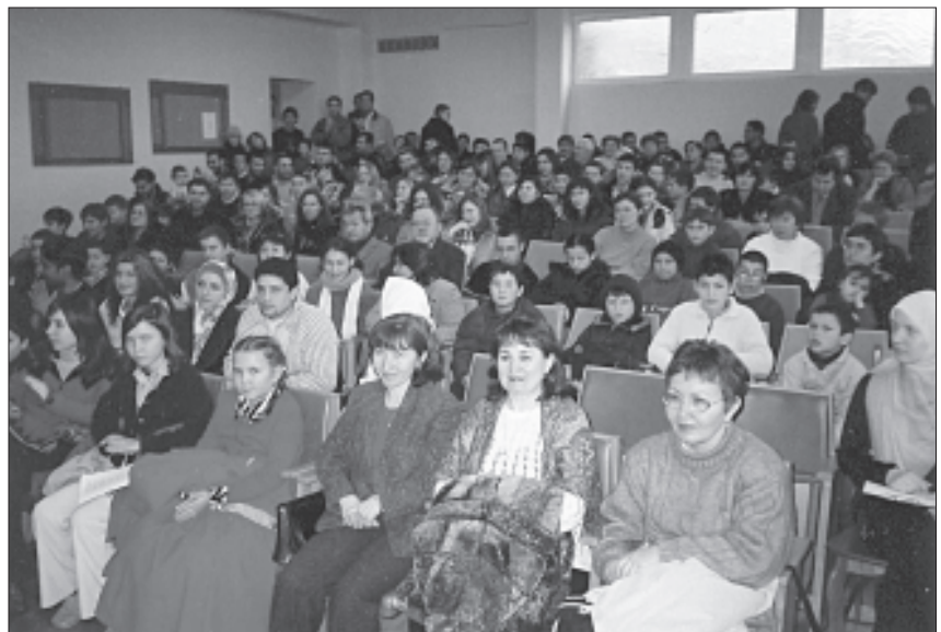
Bendras salės vaizdas.

pamokėles vaikai nubėgo atlikti apsiprausimą, ir paskui visi kartu sustojo bendrai maldai. Po maldos buvo išdalintos visiems knygutės lietuvių kalba. Laikas prabėgo greitai, ir po maldos jau turėjo visi skirstytis namo. Renginys praėjo sėkmingai. Buvo malonu matyti spindinčius, patenkintus vaikų veidus. Mums reikia dažniau praveisti tokio pobūdžio renginius, kurie yra labai svarbūs mūsų vaikams. Tarpusavyje mes esame broliai ir sesėrys, tad turime siekti ir stengtis padėti vieni kitiems, teikti džiaugsmą vieni kitiems. Tesaugu mus ir mūsų vaikus Allah.