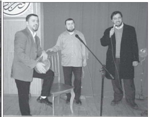
Koncerte dalyvavo čečėnai, libaniečiai ir berniukas iš Visagino