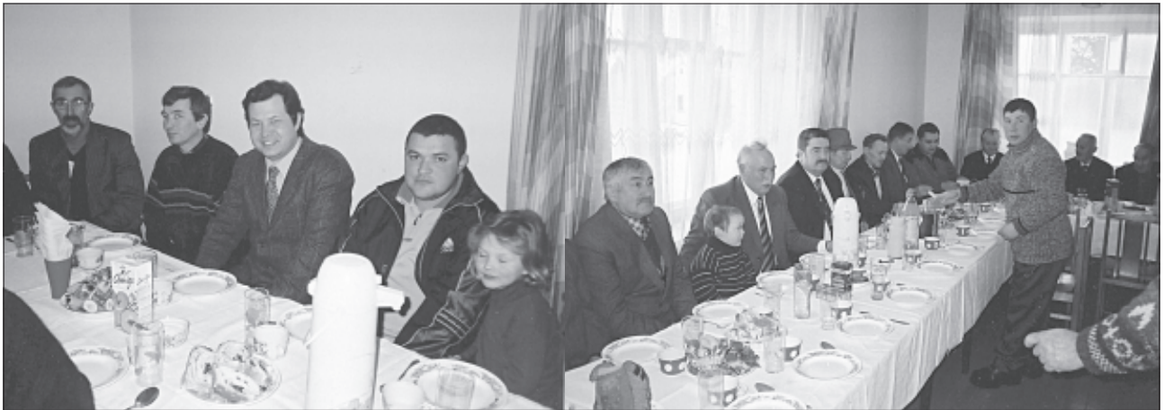
Raižių kultūros centre prie šventinio stalo susirinko apie šimtas žmonių.