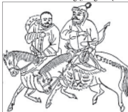
Kipčiakų paveikslai kiniečių piešiniuose,

Kur gi tas Turanas? Istorikai tvirtina, kad tai Senovės Altajus. Iš esmės tai visas Pietų Sibiras, įjungiant Baikalą ir Užbaikalę rytuose ir Pamyrą - vakaruose. Tūkstantmečius iki mūsų eros ten gyvenusios gentys turėjo savo raštą, kuris per klaidą XVIII a. pavadintas runitiniu. Nors archeologų, lingvistų ir is-