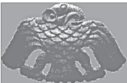
Tiurkiškas amuletas - grifas,

Ir paskutinis nevisai akivaizdus tvirtinimas. Tautos istorija ir valstybės istorija yra ne tas pats. Pavyzdžiui, prieš 600 metų mes atsikėlėme gyventi į LDK. Šioje teritorijoje nuo to laiko po Lietuvos Didžiosios kunigaikštystės buvo ir unijinė Lenkijos-Lietuvos valstybė, ir carinės Rusijos imperija, ir nepriklausoma Lietuvos respublika, po to mes tapome įjungti į TSRS sudėtį ir tapome tarybiniais piliečiais, o nuo 1991 m. vėl tapome LR piliečiais. Nuo 2004 m. gegužės mes tapome naujos Susijusios Europos Imperijos nariais. Tuo būdu toje teritorijoje per 600 metų valstybė keitėsi net septy-