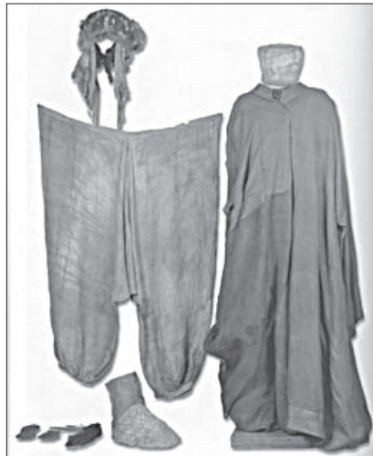
Tiurkų rūbai I me a.

nis kartus, o čia gyvenančios tautos su nežymiais pakitimais išliko tos pačios.